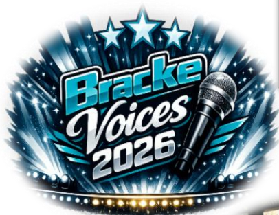
Bracke Voices 2026