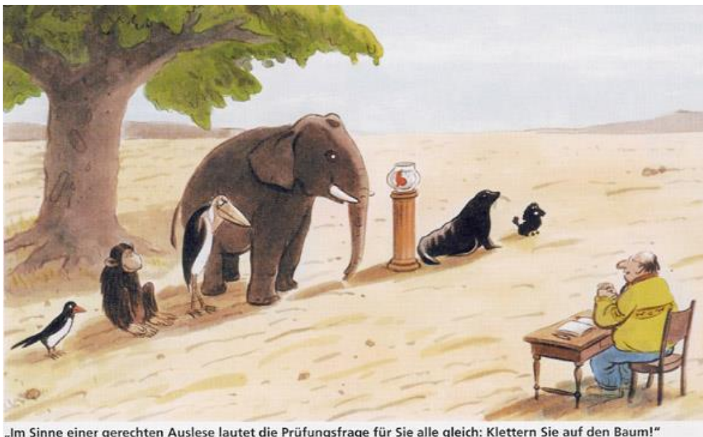
„Im Sinne einer gerechten Auslese lautet die Prüfungsfrage für Sie alle gleich: Klettern Sie auf den Baum!“

Persönlichkeitsstrukturen Probleme bekommen?